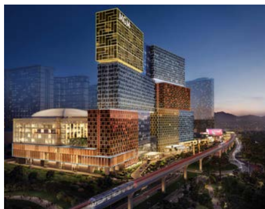
路氹美高梅酒店外觀

澳門路氹美高梅酒店項目 (MGM Cotai) 位於澳門路氹城金光大道，毗鄰金沙城中心及澳門東亞運動會體育館，外形猶如「珠寶盒」，讓人耳目一新。項目總建築面積約28萬7千平方米，將設有1,300多間客房、並設有大型會議廳、頂級水療設施、主題式綠化中庭、特色購物街、高級餐飲設施、嶄新設計的大型劇院和精彩表演、以及博彩和娛樂場地等設施。其內之非博彩元素將佔項目總面積逾85%，旨在推動澳門多元化發展，為澳門帶來更多先進及創新的娛樂體驗。項目投資約240億港元，預計於2017年第二季末開業。