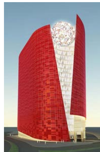
路易十三酒店外觀

路易十三酒店邀請了法國國王路易十三的直系後裔塔尼亞·波旁帕爾米公主殿下為其室內設計擔任特別顧問，融匯法國路易十三國王在位期間的巴洛克風格及現代元素，致力追求文藝復興時期貴族傳統的尊貴特色。平均每間別墅式套房耗資逾700萬美元打造。