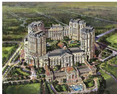
上葡京酒店鳥瞰圖

「上葡京」位於澳門路氹城，鄰近澳門東亞運動會體育館，總建築面積約60萬平方米，提供約2000間客房，是澳門博彩股份有限公司（簡稱：澳博）在澳門路氹全力打造的綜合度假村。設施包括大型購物中心、多功能劇院、博彩及娛樂場設施，以及多家由米芝蓮名廚主理之高級食府，超過95%為非博彩元素。預計2017年開業。