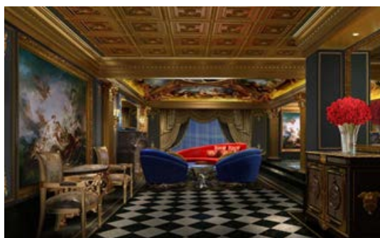
路易十三酒店大堂

路易十三酒店位於路環石排灣馬路，項目總建築面積約88,000平方米，約有200多間套房，其客房類型包括每套面積約185平方米的複式套房、每套面積約465平方米的別墅及一套面積約2,800平方米的皇家別墅，該套別墅被稱為全球最為豪華及優質的客房。項目由澳門本土公司路易十三集團有限公司發展，預計於2016年底開幕。